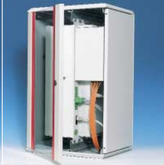
Station de monitoring, câblée.