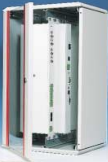
Station de monitoring dans coffret mural.